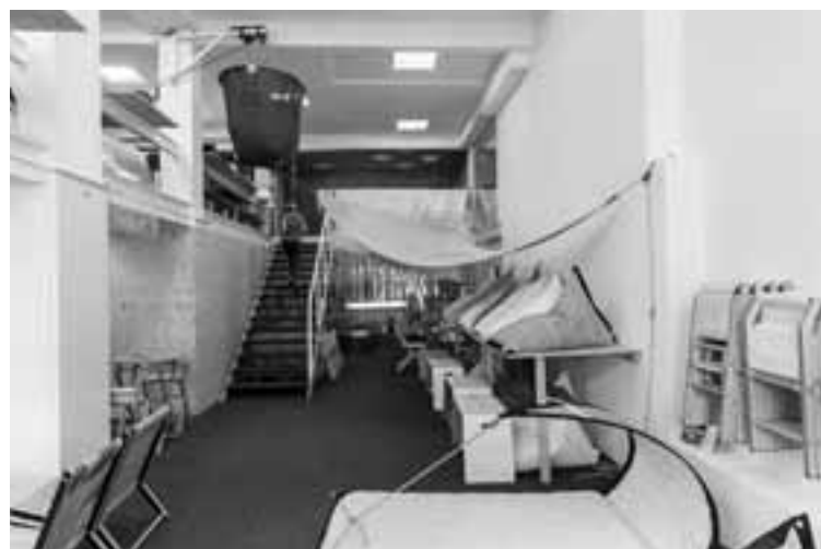
Algunos de los productos de DVelas (puf, sillón, sillas...)