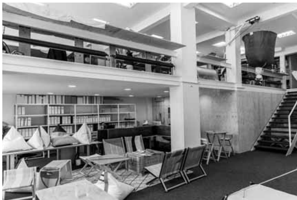
Interior del centro multidisciplinar que ocupa DVelas, con lugar de exposición y el taller arriba.

Y una cosa es que sean pocos, y otra cosa es que resulta evidente que aportan una parte importante de la recaudación. Esos 300 contribuyentes, la cúspide de la pirámide de los más ricos, suponen uno de cada 1.000 contribuyentes en Navarra, pero aportan 50 de cada 1.000 euros de recaudación en el IRPF. Se podrá discutir lo que se quiera, pero conviene recordar que pese a los eslóganes fáciles, el actual Impuesto de la Renta es progresivo y el que más ingresa, más aporta. Otra cosa es que sigue habiendo gente que no paga lo que debe (léase la lista de grande morosos) y expertos del fraude fiscal, o grandes empresas que deslocalizan beneficios (como las grandes tecnológicas de Internet). Ahí están las oportunidades para ingresar más. Combatir todos los fraudes fiscales sí debe ser una prioridad, pero preferimos el recurso más fácil y rápido de exprimir más a los que ya pagan.